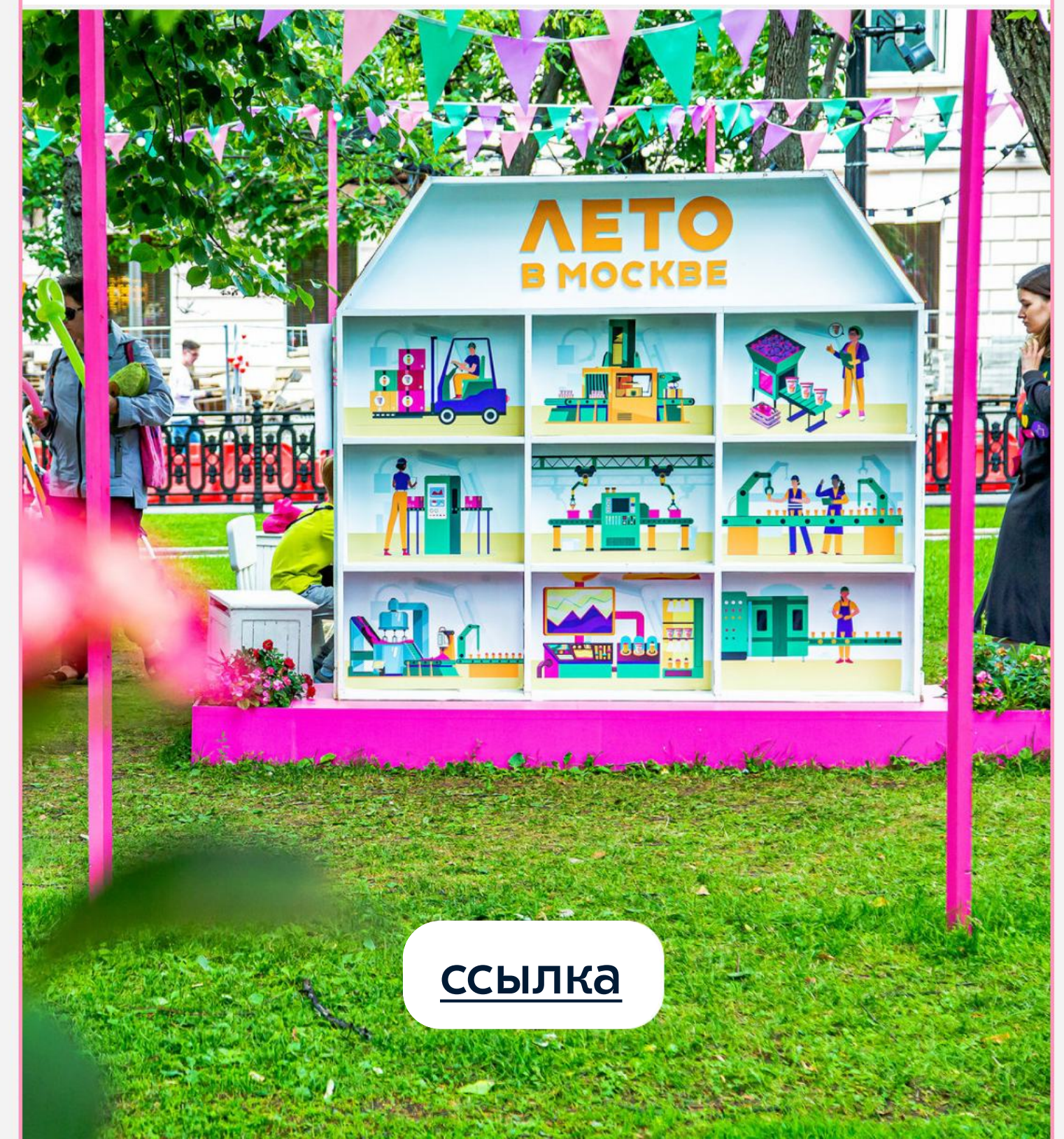
«Папа и сын»